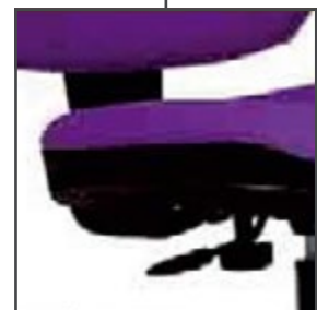
3 réglages d'assise